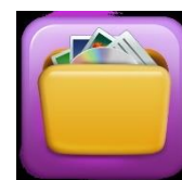
Bild När du är i OCR -förhandsvisningsläge trycker du på knappen Spara.

Du kan använda knappen Spara för att spara en bild som bild, sida eller bok: