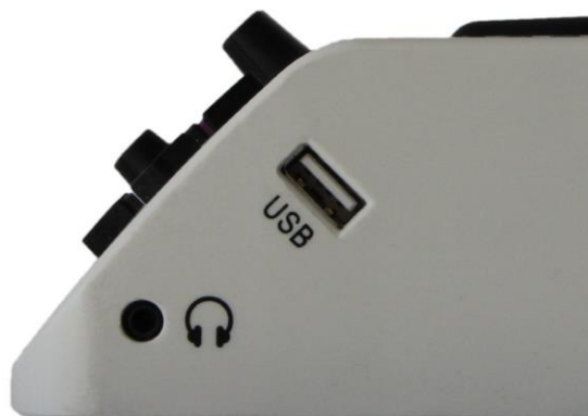
Figur 3: Höger sida

På framsidan på höger långsida finns ett rektangulär USB-anslutning. Hörlursanslutningen för 3,5 mm kontakt är placerad på nedre högra sidan i form av ett runt hål. Här kan också förstärkare för hörselskadade anslutas.