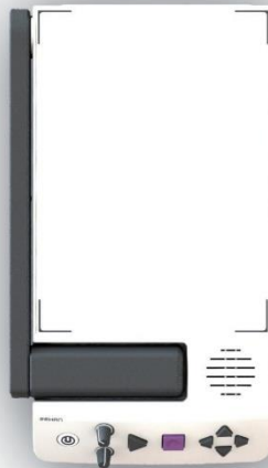
Figur 1. Översidan

Skannerkameran med integrerad LED-lampa fälls ned i enheten när den inte används eller i transportläge. Kamera-armen är placerad på vänster sida av enheten och måste lyftas upp helt för att få den till läs-läget. Högtalaren är placerad längst ner till höger. Det finns taktila markörer längst upp och längs ned på läsplattan för att kunna centrera dina dokument för bästa skanning och läsbarhet.