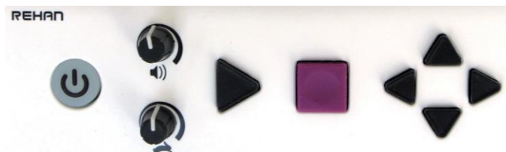
Figur 2: Främre panel

Alla driftskontroller finns på framsidan och förklaras från vänster till höger: